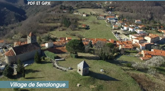
Village de Serralongue