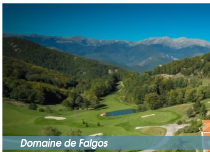
Domaine de Falgos

Parking panoramique / Can Pelat / Cantellops / Les Colomines / Falgos / Collada dels Maçaners / Forêts de Falgos / Sentier le long de la propriété de Fornells / Case Minore / Can Pelat / Parking panoramique